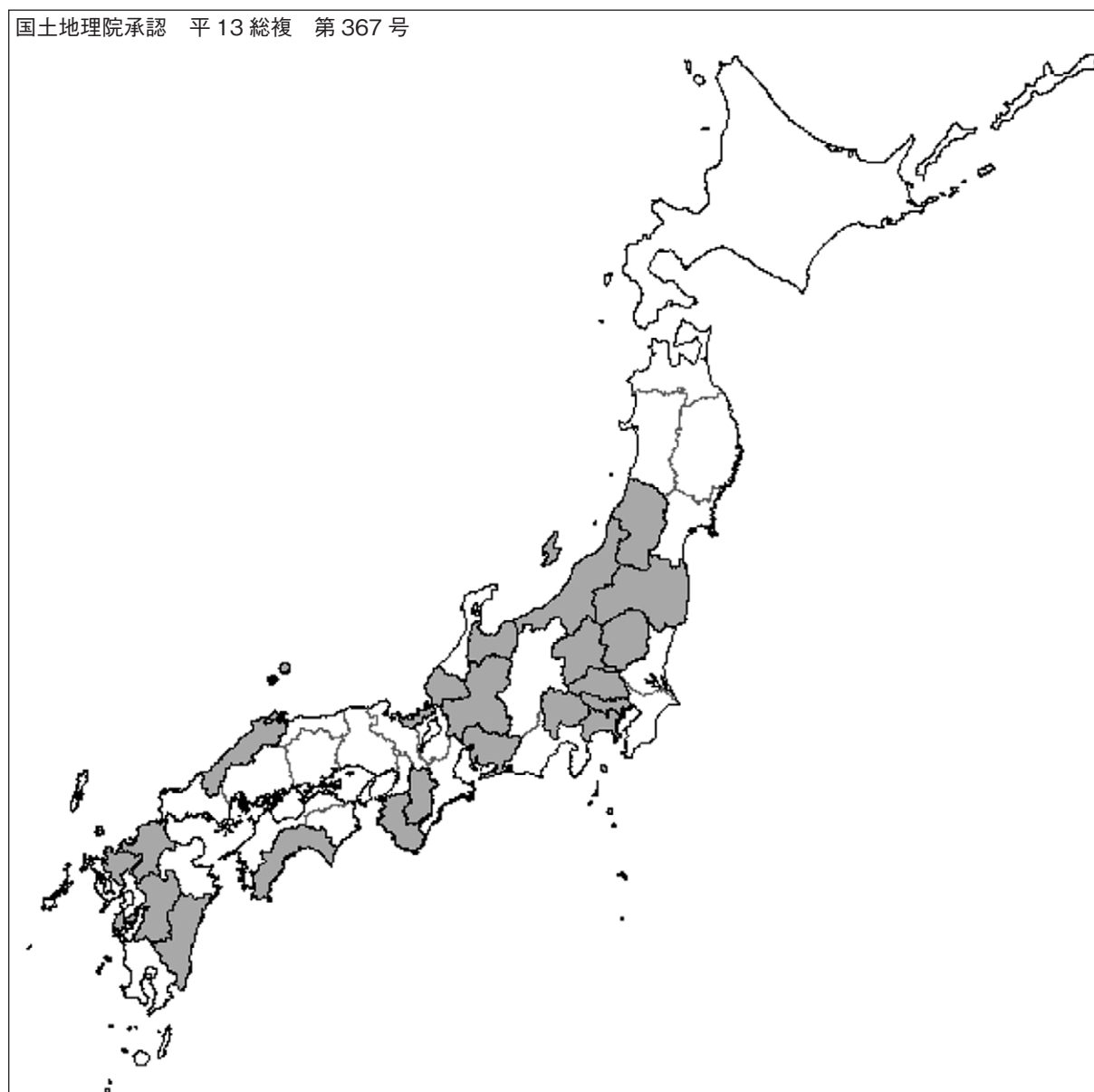
図3 自宅待機に対する手当がない都県 (2009(平成21)年4月15日奈良県調べ)