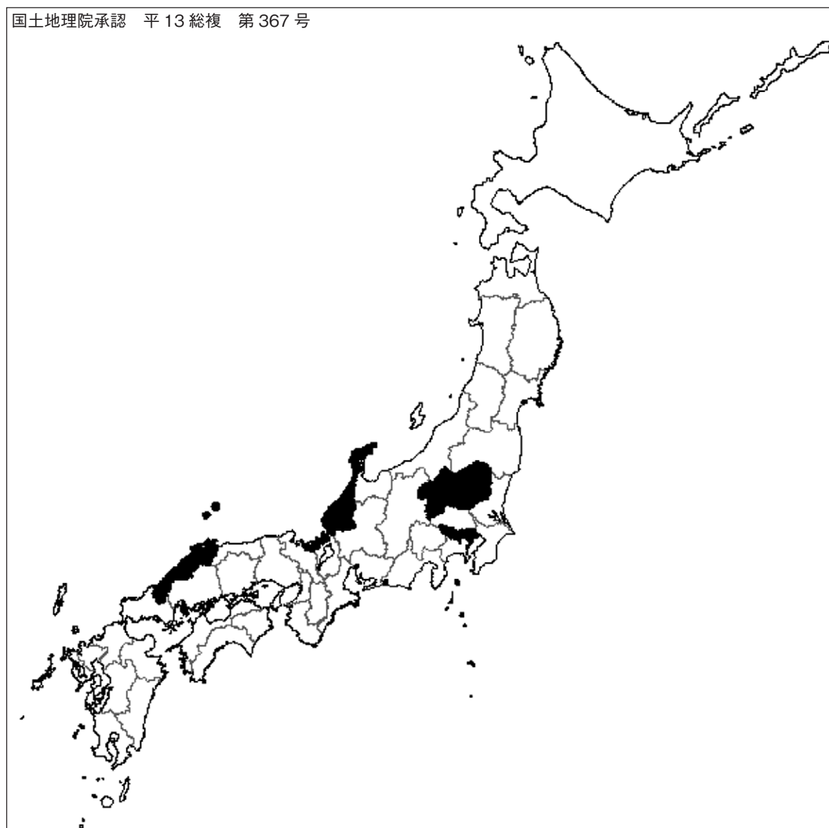
図2 宿日直中に通常業務に従事した時の取り扱いが宿日直手当だけの県 (2009(平成21)年4月15日奈良県調べ)